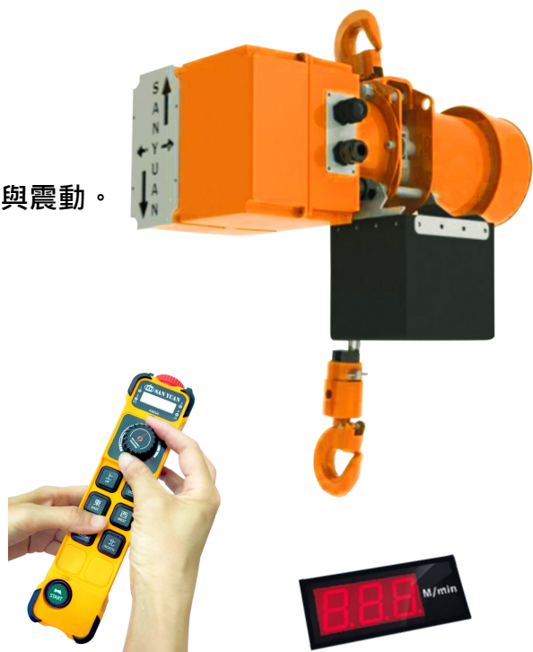
雙速按鍵 (標準配備) 旋鈕調速 (選購)