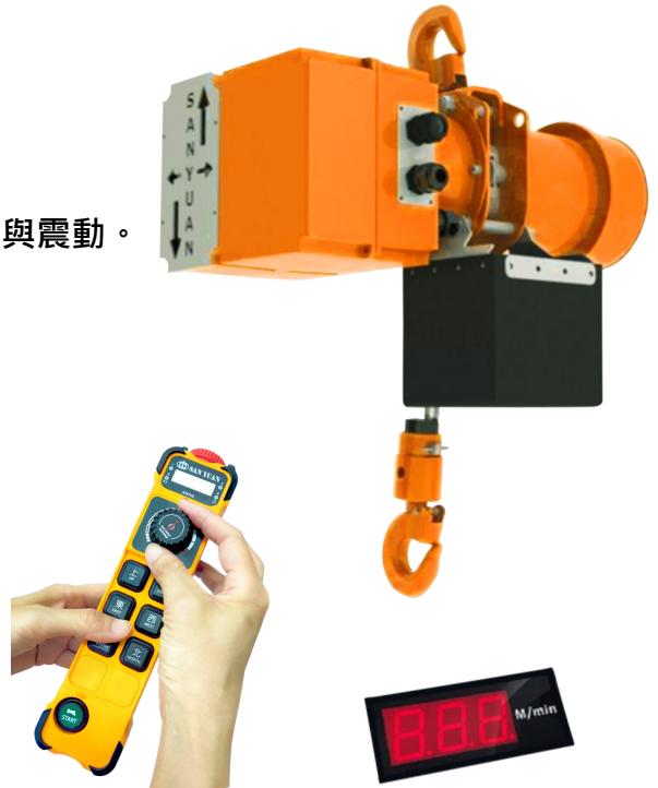
雙速按鍵 (標準配備) 旋鈕調速 (選購)